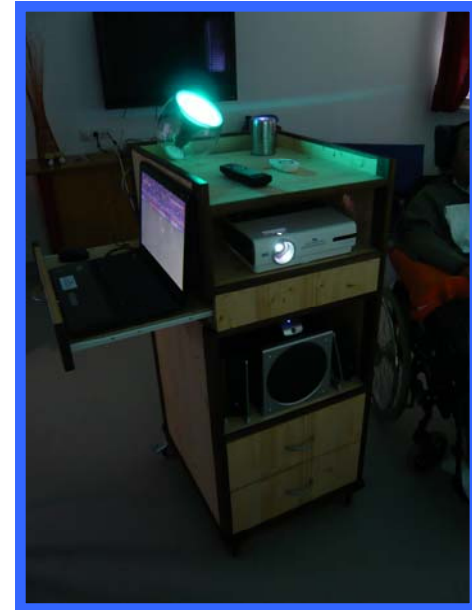
WACHKOMASTATION am LKH Rankweil