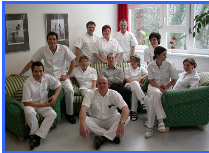
WACHKOMASTATION am LKH Rankweil